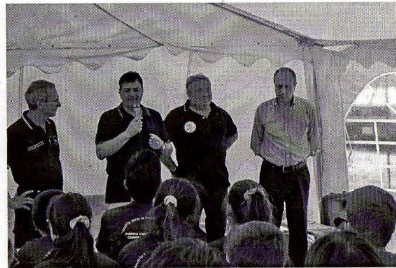
Gli interventi durante la cerimonia di chiusura