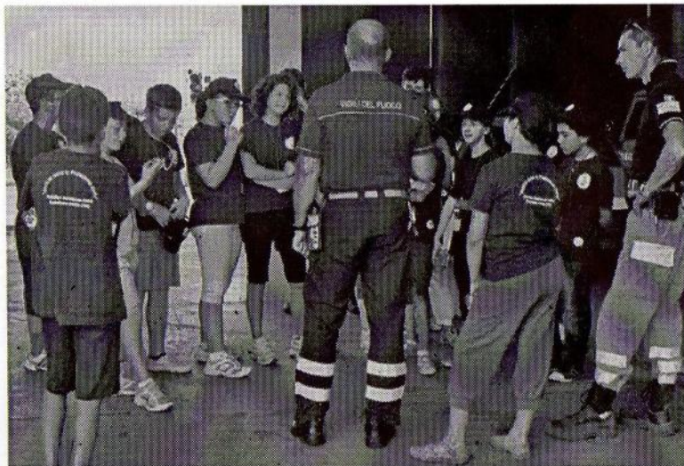
Alcune delle attività del camp organizzato dall'Avpa