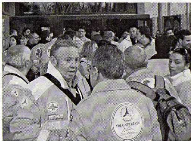
Due momenti del raduno di Firenze